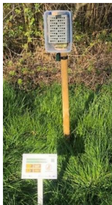
Nisthilfe am Golfclub Owingen-Überlingen e.V. Autorin: Anna Klopstock

Schon gewusst? Die Garten-Wollbiene ist ein echter Naturarchitekt! Sie baut ihr Nest aus sorgfältig gesammelten Pflanzenhaaren – ein beeindruckendes kleines Kunstwerk der Natur. Schauen Sie mal unten – so sieht eines dieser besonderen Nester aus!